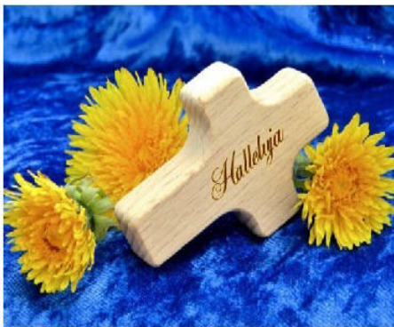
Halleluja by Sr. Jutta Gehrlein

Brannte nicht unser Herz in uns, als er unterwegs mit uns redete und uns den Sinn der Schriften eröffnete? Lk 24, 30-35